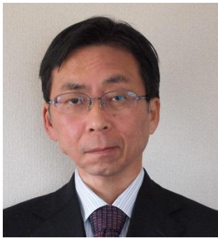
Hiroyuki Kato 加藤弘之 著